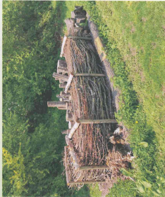
Totholzhaufen beim Flötzbach

Ziel des BioSpaz ist es, in Langenau – als eine der quellenreichsten Städte Deutschlands – das Thema Wasser stärker in den Fokus zu nehmen. Wasser als Lebensraum, Rohstoff und Element ist wertvoll und schützenswert.