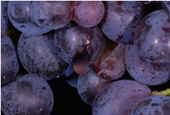
Abb. 3: Saftaustritt nach Kirschessigfliegenbefall