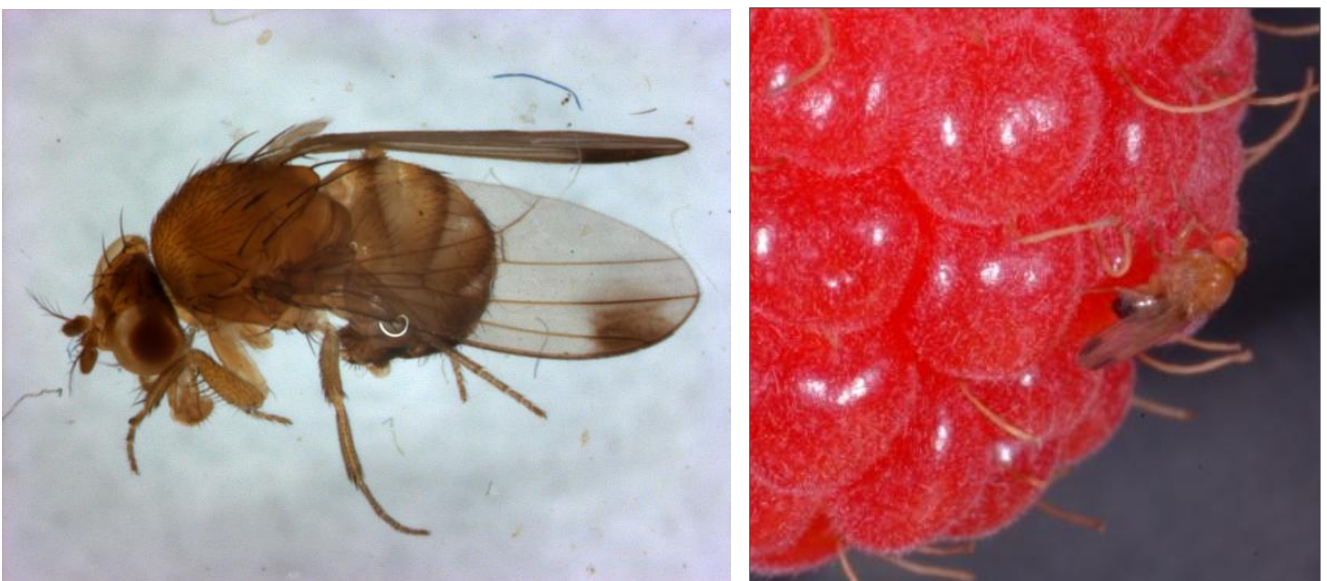
Abb. 1: Männchen der Kirschessigfliege mit den typischen Flecken auf den Flügeln

Bei Befalls-Verdacht kann Fruchtmaterial (Trauben, Wildfrüchte etc.) auch sehr leicht einige Tage in einem nur mit kleinen Luftlöchern versehenem Behältnis aufbewahrt und auf Schlupf der Fliegen untersucht werden. Die Männchen lassen sich dann, wie oben beschrieben, gut an den schwarzen Punkten auf den Flügelspitzen erkennen.