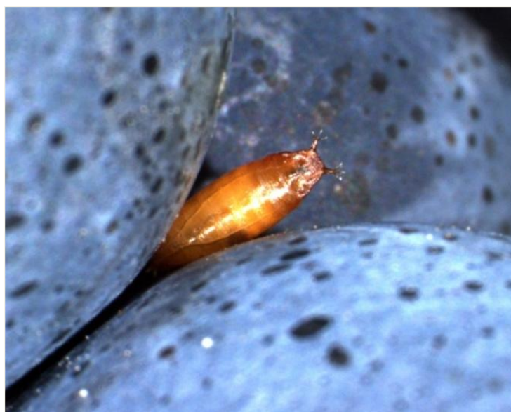
Abb. 5: Puppe mit den typischen sternförmigen Anhängen