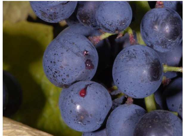
Abb. 4: Saftaustritt durch Risse in der Beerenhaut