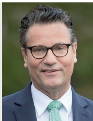
Peter Hauk MdL Minister für Ernährung, Ländlichen Raum und Verbraucherschutz Baden- Württemberg

„Die Bioökonomie bietet Lösungen für aktuelle und künftige gesellschaftliche Herausforderungen. Sie verbindet Klima- und Ressourcenschutz mit einer nachhaltigen Produktion von Nahrungsmitteln, Rohstoffen und Energie.“