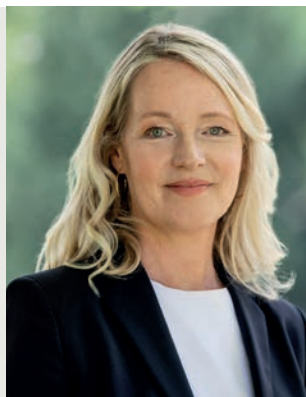
Thekla Walker MdL Ministerin für Umwelt, Klima und Energiewirtschaft Baden-Württemberg

„Mit der nachhaltigen Bioökonomie schaffen wir ein ressourcenschonendes, klimafreundliches Wirtschaftssystem mit zukunftsfähigen Arbeitsplätzen. Durch innovative, grüne Technologien können wir sekundäre Rohstoffquellen wie Abfälle, Abwasser, Abluft und CO 2 nutzen.“