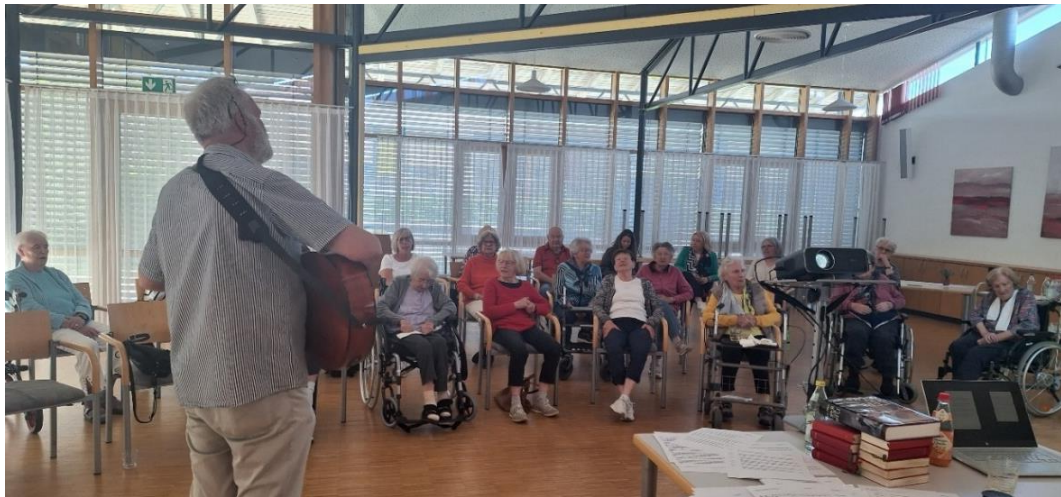
Singkreis für Menschen mit Demenz u. a.