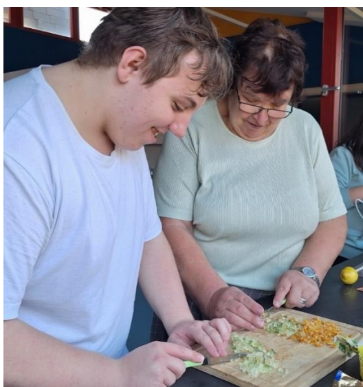
Dez. 2024: Schüler backen mit den Landfrauen