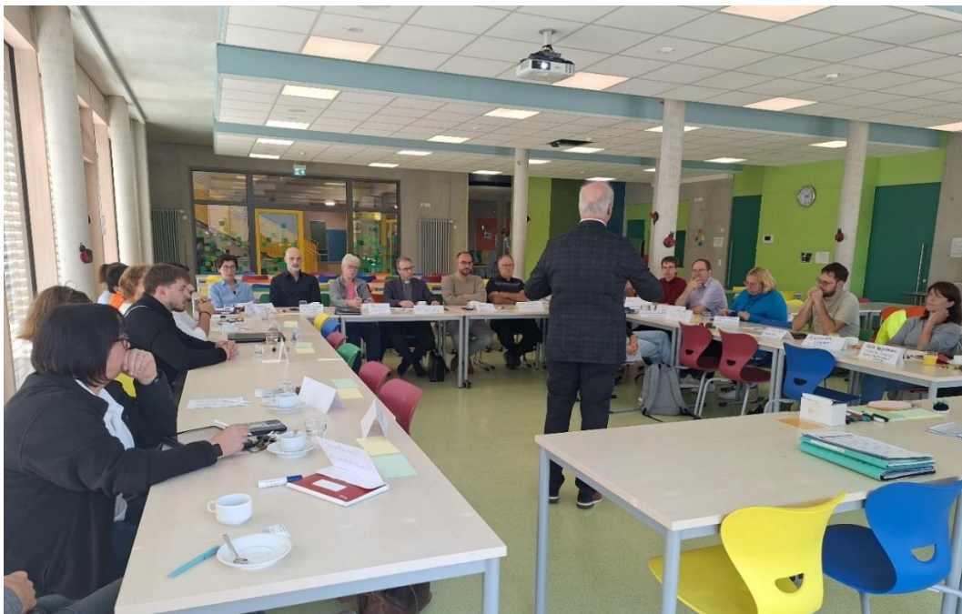
März 2025: Runder Tisch Soziales, Waldstetten