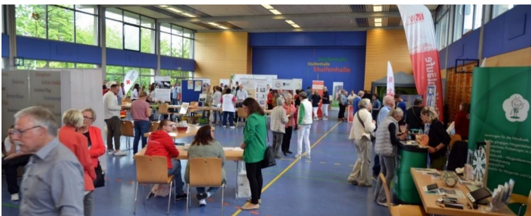
Mai 2025: Gesundheits- und Pflegemesse Waldstetten