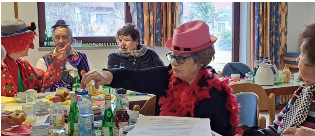
Feb. 2024: Faschingsfeier beim Schwätznachmittag