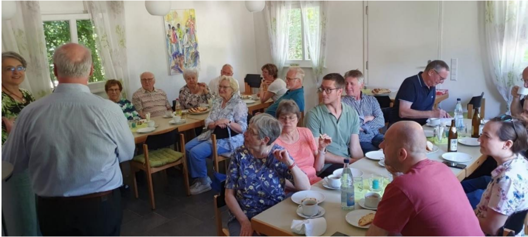
Nachbarschaftsgespräch Weilerstoffel 2024