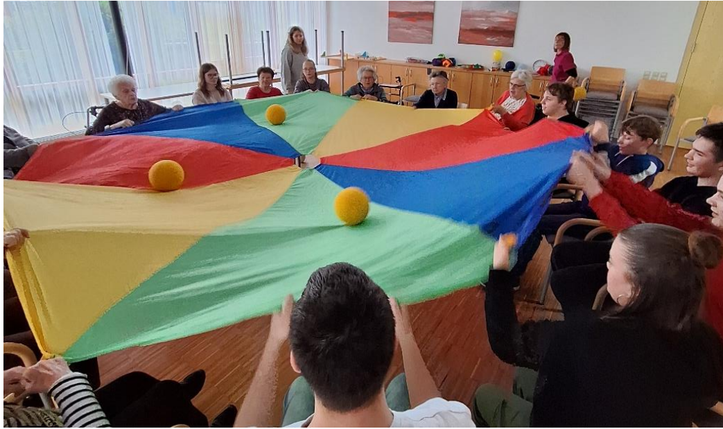
Jugendliche und Senioren bei gemeinsamen Bewegungsübungen