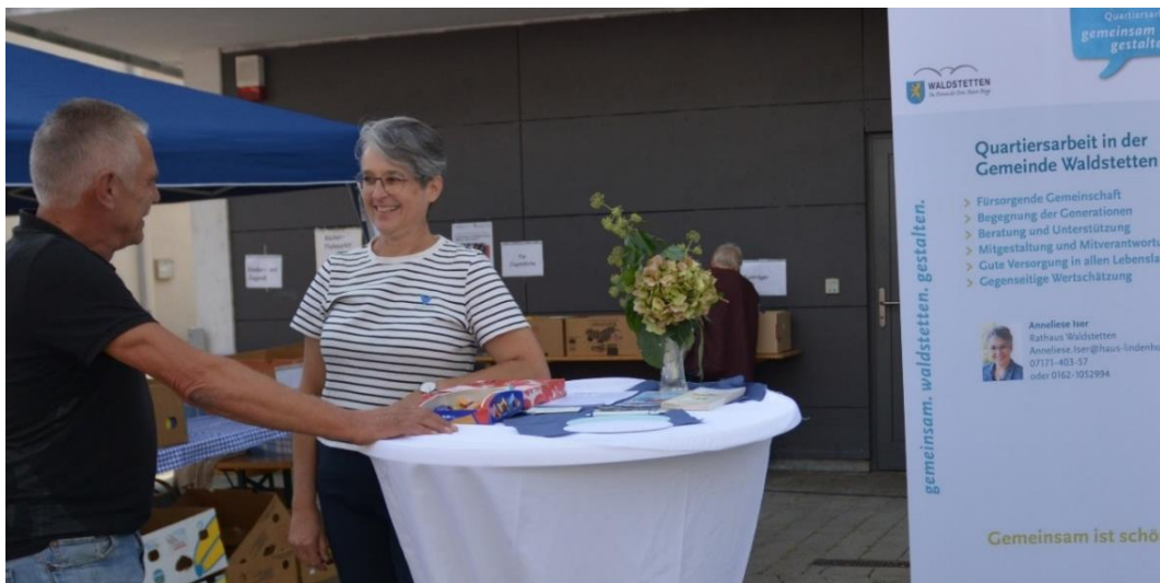
Infostand auf dem Waldstetter Herbst