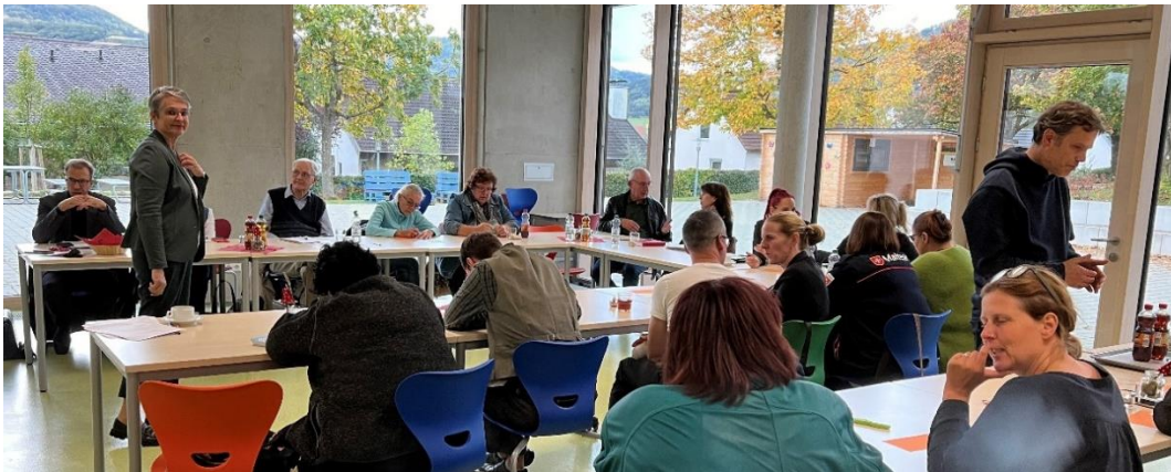
Runder Tisch Soziales Okt. 2024