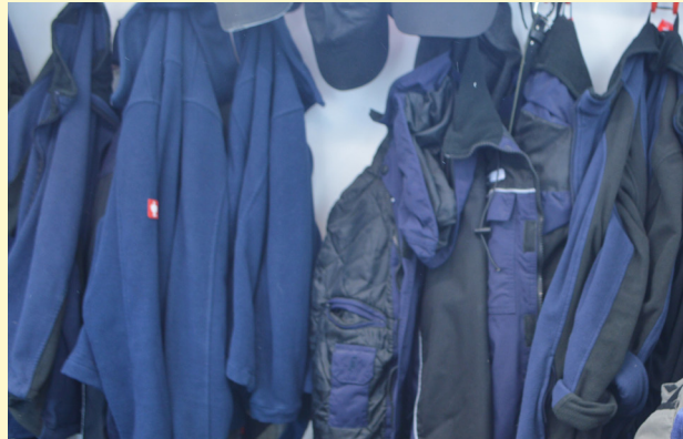
Betreten der Ställe ausschließlich in Stallbekleidung