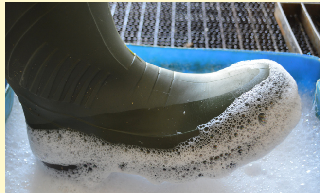
Reinigung und Desinfektion der Stiefel vor und nach dem Betreten des Stalls