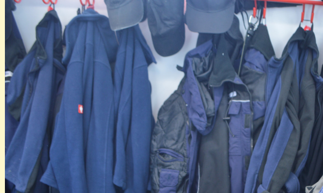
Betreten der Ställe ausschließlich in Stallbekleidung