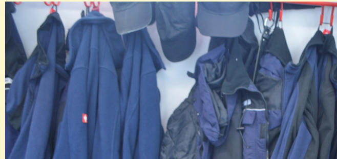
Betreten der Ställe ausschließlich in Stallbekleidung