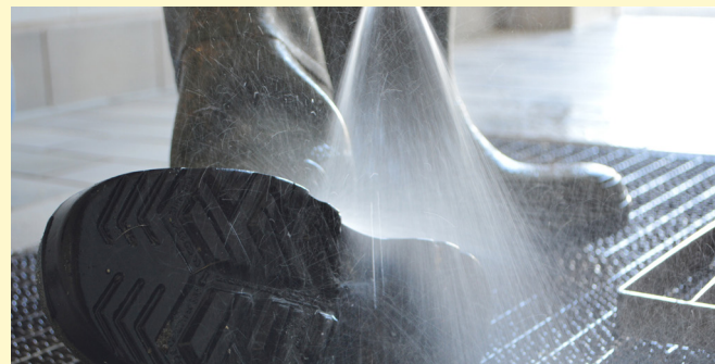
Reinigung und Desinfektion der Stiefel vor und nach dem Betreten des Stalls

Besondere Vorsicht gilt bei Transportfahrzeugen, Kleidung, Hunden und Gegenständen, die im Rahmen der Jagdausübung in Berührung mit Wildschweinen kommen.