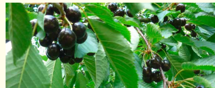
Foto unten: Brenn- und Schüttelkirsche „Benjaminler“ - Streuobstsorte des Jahres 2015 in Baden-Württemberg

Universität Hohenheim www.uni-hohenheim.de/gaerung/Brennereikurse.html