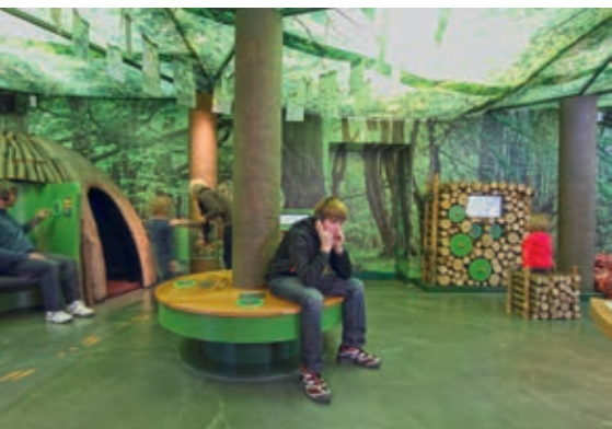
Oben: Biosphärenzentrum Schwäbische Alb

Um einen ersten Einblick in die Gebietskulisse zu bekommen, empfiehlt sich ein Besuch im Biosphärenzentrum Schwäbische Alb. Das Besucher- und Informationszentrum wartet mit einer rund 450 Quadratmeter großen interaktiven Ausstellung zum Biosphärengebiet auf. Sechs Tage die Woche können Gäste auf spannende und kreative Weise das erste Großschutzgebiet dieser Art in Baden-Württemberg kennen lernen.