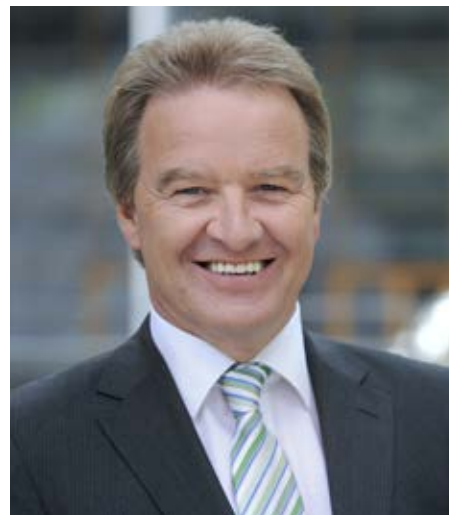
Franz Untersteller MdL Minister für Umwelt, Klima und Energiewirtschaft