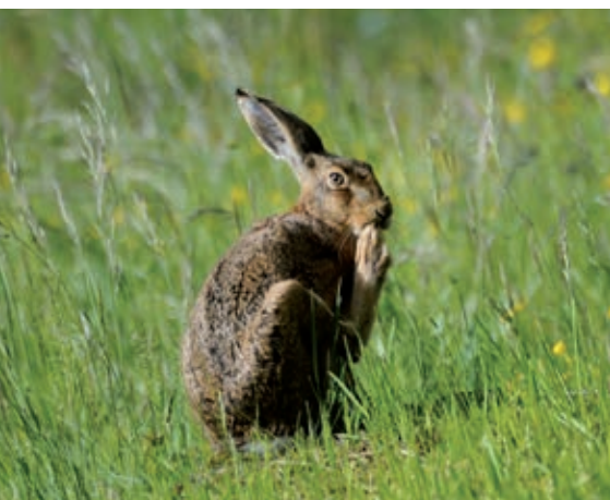
Oben: Feldhase im Naturpark Schönbuch

Die Nationalen Naturlandschaften Baden-Württembergs sind aber nicht nur schöne Ferienregionen. Sie sind ein bewährtes Instrument zur nachhaltigen Entwicklung der ländlichen Räume. Für die verschiedenen Schutzgebietstypen gibt es spezielle Förderprogramme. Die Finanzmittel dafür stammen direkt vom Land und aus der Lotterie „Glücksspirale“. Sie werden in den meisten Fällen durch Mittel der EU ergänzt. Die Fördergelder werden zusammen mit den Akteuren vor Ort beispielsweise in nachhaltigen Tourismus, Regional-