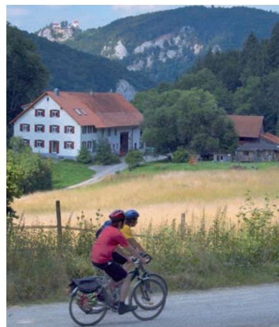
Oben: Im Frühjahr geradezu paradiesisch - die zahlreichen Streuobstwiesen Unten: Radfahrer auf Donautalradweg beim Scheuerlehof

Ebenfalls landesweit finden in unseren Großschutzgebieten jährlich rund 50 Märkte statt, zu denen weit über 100.000 Besucher kommen, um regionale Produkte zu kaufen.