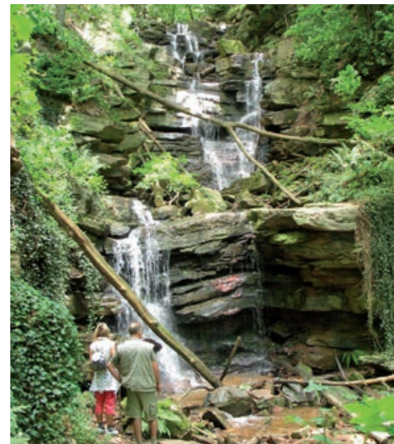
Oben: Streuobstwiese bei Eberbach

info@np-no.de www.naturpark-neckartal-odenwald.de