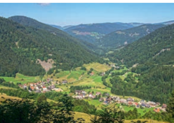
Oben: Die Sonnenseite des Schwarzwaldes: Blick vom keinen Spießborn in Bernau Mitte: Blick von Wilfingen: Abendstimmung mit Alpenpanorama Unten: Blick in den Gletscherkessel Präg mit Blockschutthalde „Seehalde“

Der Südschwarzwald ist eine Kulturlandschaft. Wer genau hinschaut, kann es noch erkennen an den Mauern und Steinhaufen, an den ehemaligen Gräben und an den „Kohlplatten“, wo einst in großer Zahl Holzkohle hergestellt wurde. Damals war der Schwarzwald seines Waldes fast völlig beraubt. Heute setzen wir uns dafür ein, dass nicht noch mehr Fläche wieder zu Wald wird. Die Gründe sind mannigfaltig: Der Wechsel zwischen Wald und Offenland bietet einer Vielzahl an Pflanzen und Tieren einen vielfältigen Lebensraum und den Menschen einen abwechslungsreichen Lebens- und Erholungsraum. Schon in den Jahren 2002 bis 2012 gab es deshalb ein Naturschutzgroßprojekt im Bereich Feldberg-Belchen-Oberes Wiesental und im Hotzenwald von 2005 bis 2011 ein LIFE-Projekt. Ziel dabei war immer, durch höhere Wertschöpfung einen Beitrag zur Aufrechterhaltung der Landbewirtschaftung zu leisten.