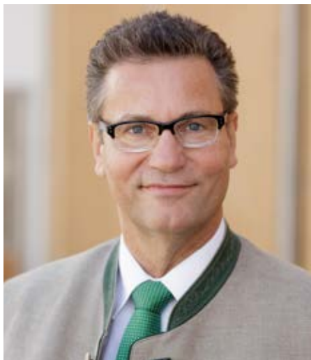
Peter Hauk MdL Minister für Ländlichen Raum und Verbraucherschutz

In dieser Broschüre stellen wir Ihnen die Nationalen Naturlandschaften Baden-Württembergs vor. Lassen Sie sich inspirieren und begeistern von den vielfältigen Naturlandschaften in Baden-Württemberg.