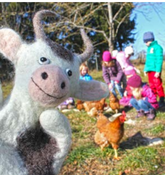
Oben: Typische Schwarzwälder Kulturlandschaft bei Oberharmersbach

Einmalige Ausblicke und regionale Hochgenüsse