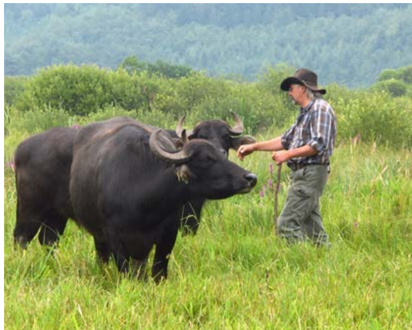
Oben: Blick ins Lautertal